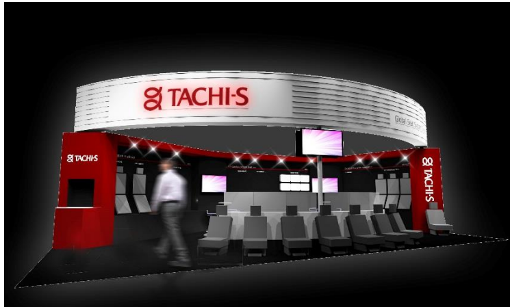
タチエスブース 外観イメージ

なお、プレスデー（4月17日）には当社ブース（6.2H 6BC085 零部件館）において、プレスブリーフィングを予定しております。