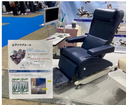
エアバリアシート

当社ブースでは、新型スケールベッド・新型3モーター電動ベッドに加え、日機装株式会社様と共同開発した透析チェア（エアバリアシート）の試作品を展示しました。これには、日機装様開発の深紫外線LEDを搭載している空間除菌消臭装置を内蔵しており、顔周りに除菌・消臭された空気が流れ快適な空間を提供するものです。