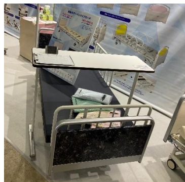
新型3モーター電動ベッド