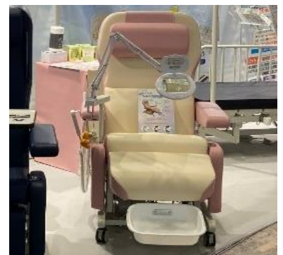
フットケア用電動チェア