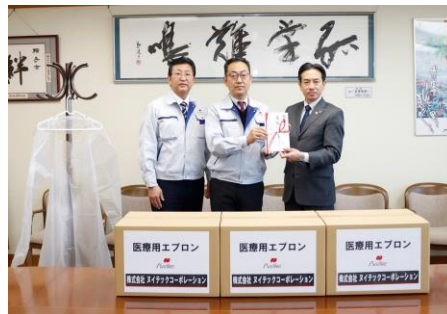
贈呈式の様子（市役所本庁舎にて）